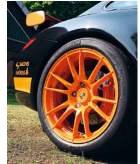
Auf einteiligen OZ-"Ultraleggera": Michelin-"Pilot Sport Cup" (235/35 ZR19 und 305/30 ZR19)