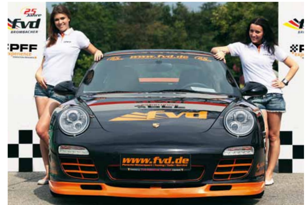
Windsbräute: großzügige Öffnungen zur Kühlung von Wasser und Bremsen in sowie unter der Bugschürze