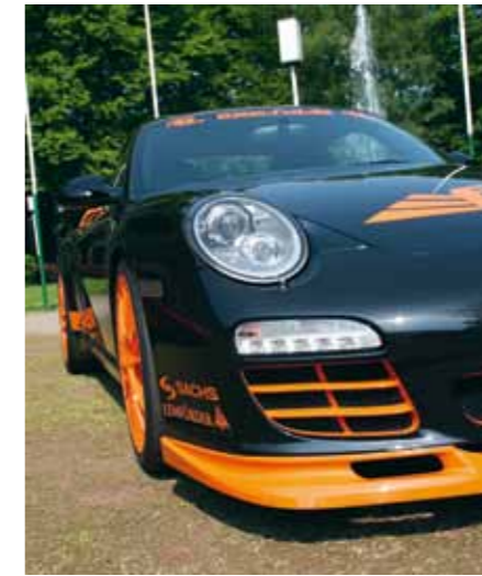
Lighthouse Family: Bi-Xenon-Scheinwerfer, dynamisches Kurvenlicht, Tagfahrlicht mit sechs LED