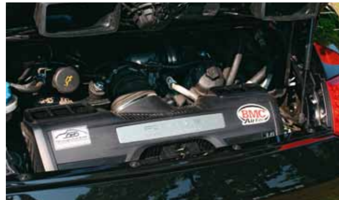
Serie (385 PS) plus 38: Der 3,8 Liter große Sauger im 911 Carrera S leistet nun 423 PS bei 6.500/min