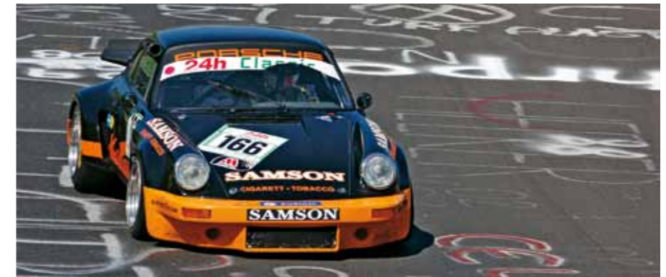
Selbstgedreht: Schwarz mit Orange – diesen Look gab es 1974 schon einmal an den Samson-Kremer-RSR

Gegen die Strömung: Recaro-"Pole Position"-RS-Sitze mit Lederbezügen und farblich abgesetzten Nähten