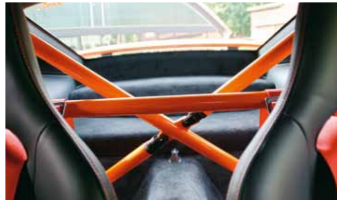
Gefertigt bei Heigo: Überrollbügel unterstützt die Karosserie-Steifigkeit und schafft sportliches Flair

halt auch an Stop-and-Go im Straßenverkehr, da will man keinen Schaltwagen mehr haben. 80 Prozent aller neuen 911 werden zurzeit mit PDK bestellt. Und in Asien kauft keiner mehr einen Schalter."