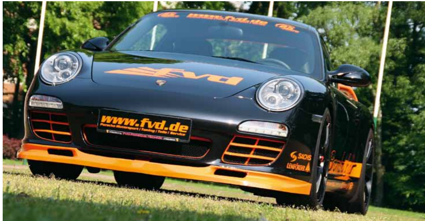
Plakatives Farbleitsystem: Auffälliges RAL-Orange markiert wesentliche Änderungen – außen und innen